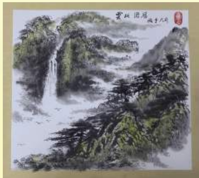
孔宪玉《云山固居》绘画类第三名